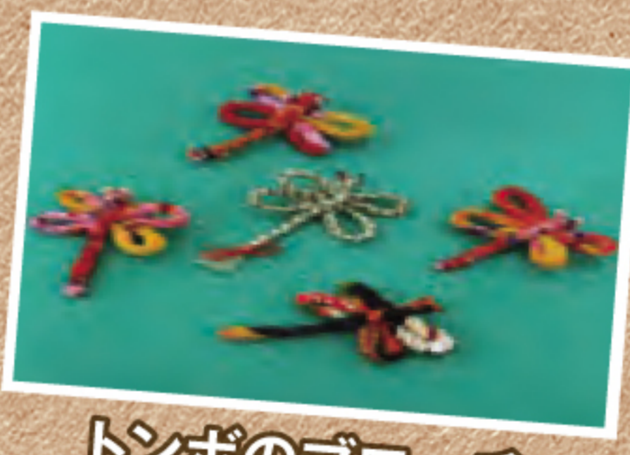
トンボのプローチ

血圧測定、体脂肪測定 体温計、はかりの無料点検→三重県計量協会 エコライフチェック→地球温暖化防止センター 私たちの活動報告写真展示