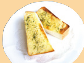
ガーリックトースト 500円(税込)