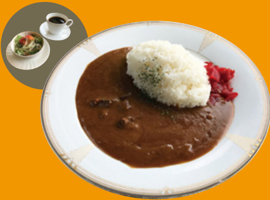
ビーフカレーライスセット