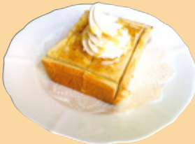
ふんわり ハニートースト 500円(税込)