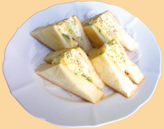
ホットサンド ポテト (ポテトサラダ+ねり玉子+野菜) 750円(税込)