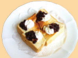
小倉トースト 500円(税込)