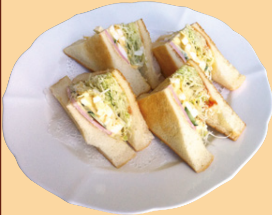
ホットサンド ハム (ロースハム+ねり玉子+野菜) 750円(税込)