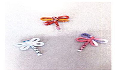
トンボのプローチ