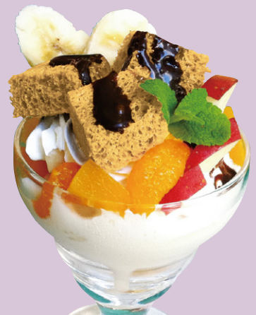
ミニパフェ シフォンケーキ 580円(税込)