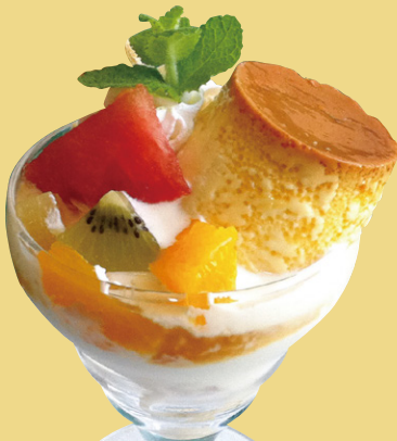
ミニパフェ 自家製プリン 580円(税込)