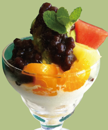
ミニパフェ 抹茶あずき 580円(税込)