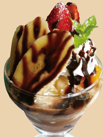
ミニパフェ チョコバナナ 580円(税込)