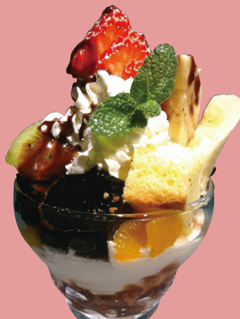
ミニパフェ コーヒーゼリー 580円(税込)