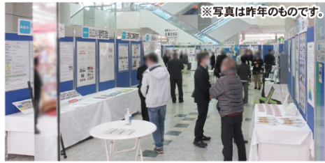
※写真は昨年のものです。