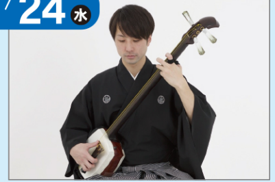
津軽三味線奏者 / 鈴鹿と・き・め・きカルチャー大使