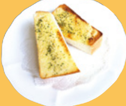
ガーリックトースト 600円(税込)