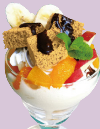
ミニパフェ シフォンケーキ 680円(税込)