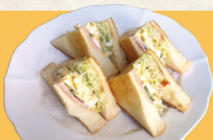
ホットサンド ハム (ロースハム+ねり玉子+野菜) 900円(税込)