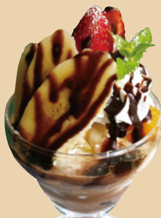
ミニパフェ チョコバナナ 680円(税込)