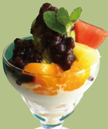
ミニパフェ 抹茶あずき 680円(税込)