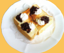
小倉トースト 750円(税込)