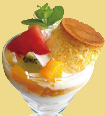
ミニパフェ 自家製プリン 680円(税込)