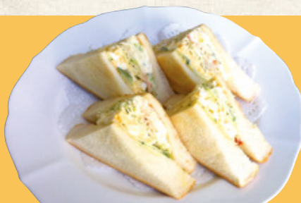
ホットサンド ポテト (ポテトサラダ+ねり玉子+野菜) 900円(税込)