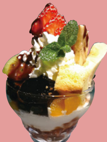
ミニパフェ コーヒーゼリー 680円(税込)